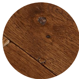
Massif : nœuds non bouchés Loft pro : nœuds bouchés